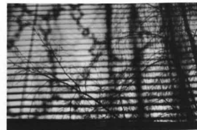
Jiří Ernest, Grenoble, z cyklu Proměny, 2004, černobílá fotografie, 13 x 18 cm