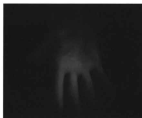
Tomáš Dittrich, Love, 2004, video, 00:01:27.

Video a instalace Tomáše Dittricha (1979) představují třetí pol výstavy. Dittrich na jedné straně pracuje s romantizujícími prvky, na straně druhé používá postupy, jež mohou zřejmě nejlépe vystihnout podstatu současného dění. Video Love a TV se formou krátkých záběrů dostávají až na pomezí reality a snu. Love je intimní příběh o vztazích dvou lidí – jedná se zároveň o autorreflexivní výpověď. Pravidelný rytmus, připomínající tep srdce, odměřuje délku sekvencí – záběrů, které lze jen stěží v tak krátkém časovém úseku uchopit. Jejich vjem odpovídá perifernímu vidění a navozuje pocit bdění. Podobně TV je velmi subjektivní reakcí na odlišné prostředí sídliště. Dittrich zpracovává toto téma osobitým způsobem. Nesnaží se pouze vytvářet příběh, ale se zaujetím mapuje existenciální situace: „pohled z okna na stovky obrazovek, které blikají, z nichž se valí tisíce informací, které není lidský mozek schopen zpracovávat“. Přestože je tato