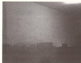
Tomáš Dittrich, Prostory v čase , 2006, digitální černobílá fotografie, 50 x 60 cm

V městských vedutách Tomáše Dittricha je scéna ve vyhraněných konturách oprostěna od veškerých zbytečností. Architektonický objekt či jeho pouhý fragment předjíímá v určitém kontextu okamžiku některé kvality, jež může v jiném nenávratně pozbýt. V konečném a analyticky vyváženém řádu obrazu, jenž má zcela odlišné zaměření a jiné pojetí, než je tomu u snímků Jiřího Ernesta, sledujeme jakousi transformovanou pouť nočního chodce. Z tradičního meziválečného a válečného moderního umění přejímá Dittrich, jak sám říká, „jakousi vizuálnost, ale přenesenou na současné téma i výrazové postupy a prostředky“. Spíše než o konstruktivistická nebo funkcionalistická řešení (ačkoliv se v přísně vyváženém skladebném řešení tyto paralely nabízejí) jde o inspiraci v poetice hákovských nočních ulic a některých dalších přesmyček Skupiny 42. Soubor vznikl v delším časovém horizontu a volně navazuje na autorovy dřívější snímky (z cyklů Modrá / City , Z deníku atd.). Útržky a fragmenty, náznaky a nedořčenost před jasnou formulací nebo dokonce realistickým popisem. Autor není uprtným pozorovatelem detailů života prefabrikovaného města, a přesto jsou jeho sondy součástí každodennosti. Důvodem je jeho setrvalá přítomnost v tomto prostoru, ale zároveň i určité stavy myšlení, plynoucí z nechtěnosti sevření okolní masou.